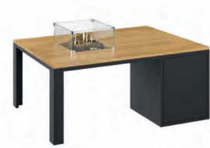
ALESSO 120 COLLECTA negro / teca

Estructura: Ref: ALEN0120 | EAN: 8414706006921 Sobre: Ref: ENCP0120 | EAN: 8414706007010