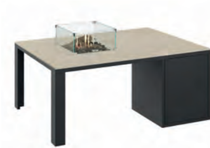
ALESSO 120 COLLECTA negro / arena

Estructura: Ref: ALEB0120 | EAN: 8414706006938 Sobre: Ref: ENCT0120 | EAN: 8414706006983