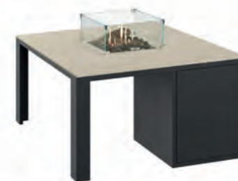
ALESSO 90 negro / arena

Estructura: Ref: ALEB0090 | EAN: 8414706007034 Sobre: Ref: ENCT0090 | EAN: 8414706007041