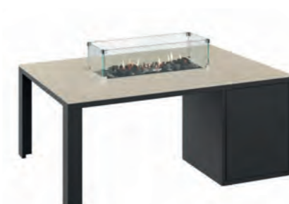
ALESSO 120 LINEA negro / arena

Estructura: Ref: ALEB0120 | EAN: 8414706006938 Sobre: Ref: ENLT0120 | EAN: 8414706006945