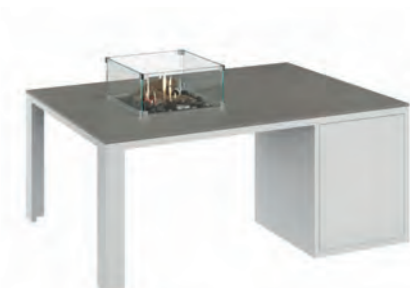
ALESSO 120 COLLECTA blanco / gris plomo

Estructura: Ref: ALEB0120 | EAN: 8414706006938 Sobre: Ref: ENCA0120 | EAN: 8414706006990