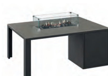
ALESSO 120 LINEA negro / gris plomo

Estructura: Ref: ALEN0120 | EAN: 8414706006921 Sobre: Ref: ENLA0120 | EAN: 8414706006952