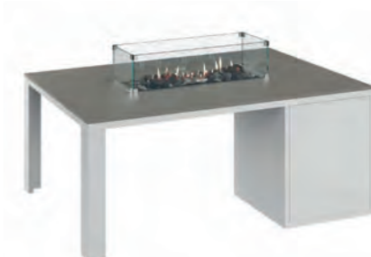
ALESSO 120 LINEA blanco / gris plomo

Estructura: Ref: ALEB0120 | EAN: 8414706006938 Sobre: Ref: ENLA0120 | EAN: 8414706006952