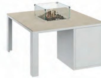
ALESSO 90 blanco / arena

ESTRUCTURA: Aluminio blanco o negro. SOBRE: Madera de teca natural o piedra sinterizada Neolith® en color arena, gris plomo y piedra. MEDIDAS: 90 x 90 x 47 cm QUEMADOR: Cuadrado 30 x 30 x 11 cm. ALIMENTACIÓN: Botella propano BUTSIR PRO 5 kg CONSUMO: 509 g/h máx POTENCIA: 7.000 W INCLUYE: Cristal protector, troncos cerámicos, piedra volcánica y funda de protección. Botella no incluida.