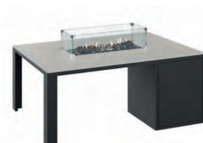
ALESSO 120 LINEA negro / piedra

Estructura: Ref: ALEN0120 | EAN: 8414706006921 Sobre: Ref: ENLG0120 | EAN: 8414706006969