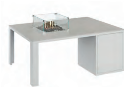
ALESSO 120 COLLECTA blanco / piedra

Estructura: Ref: ALEB0120 | EAN: 8414706006938 Sobre: Ref: ENCG0120 | EAN: 8414706007003