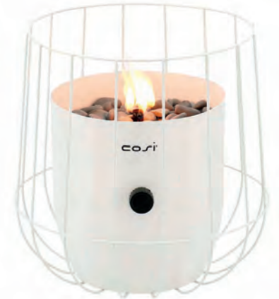
COSISCOOP BASKET blanco Ref: COSI0006 EAN: 8712757458882