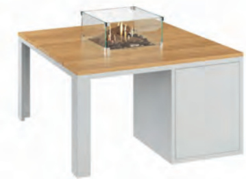
ALESSO 90 blanco / teca

Estructura: Ref: ALEB0090 | EAN: 8414706007034 Sobre: Ref: ENCP0090 | EAN: 8414706007072