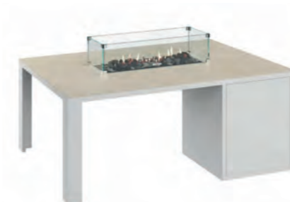
ALESSO 120 LINEA blanco / arena

ESTRUCTURA: Aluminio blanco o negro. SOBRE: Madera de teca natural o piedra sinterizada Neolith® en color arena, gris plomo y piedra. MEDIDAS: 120 x 80 x 47 cm QUEMADOR: Lineal 60 x 22 x 11 cm ALIMENTACIÓN: Botella propano BUTSIR PRO 5 kg CONSUMO: 619 g/h máx POTENCIA: 8.500 W INCLUYE: Cristal protector, piedra volcánica y funda de protección. Botella no incluida.