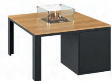
ALESSO 90 negro / teca

Estructura: Ref: ALEN0090 | EAN: 8414706007027 Sobre: Ref: ENCP0090 | EAN: 8414706007072