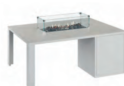
ALESSO 120 LINEA blanco / piedra

Estructura: Ref: ALEB0120 | EAN: 8414706006938 Sobre: Ref: ENLG0120 | EAN: 8414706006969