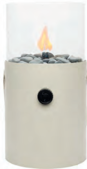
COSISCOOP ORIGINAL marfil Ref: COSI0003 EAN: 8712757456499