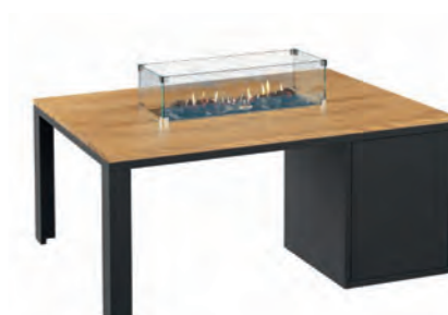
ALESSO 120 LINEA negro / teca

Estructura: Ref: ALEN0120 | EAN: 8414706006921 Sobre: Ref: ENLP0120 | EAN: 8414706006976