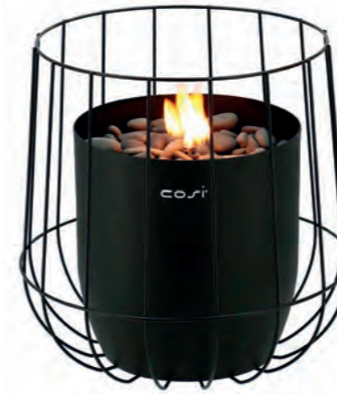
COSISCOOP BASKET negro Ref: COSI0008 EAN: 8712757458899