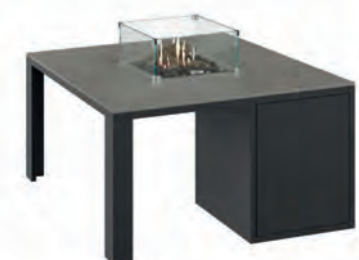
ALESSO 90 negro / gris plomo

Estructura: Ref: ALEN0090 | EAN: 8414706007027 Sobre: Ref: ENCA0090 | EAN: 8414706007058