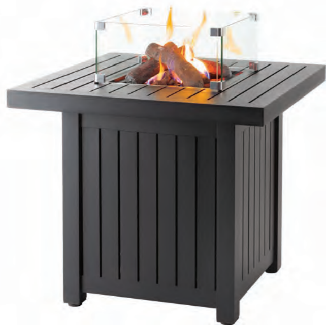
Ref: FIRE0018 EAN: 8414706006815