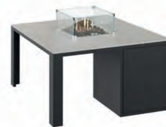
ALESSO 90 negro / piedra

Estructura: Ref: ALEN0090 | EAN: 8414706007027 Sobre: Ref: ENCG0090 | EAN: 8414706007065