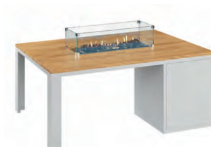
ALESSO 120 LINEA blanco / teca

Estructura: Ref: ALEB0120 | EAN: 8414706006938 Sobre: Ref: ENLP0120 | EAN: 8414706006976