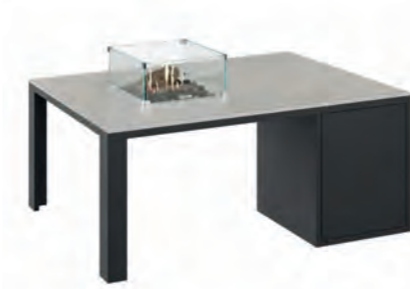
ALESSO 120 COLLECTA negro / piedra

Estructura: Ref: ALEN0120 | EAN: 8414706006921 Sobre: Ref: ENCG0120 | EAN: 8414706007003