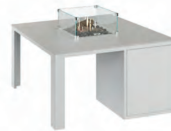
ALESSO 90 blanco / piedra

Estructura: Ref: ALEB0090 | EAN: 8414706007034 Sobre: Ref: ENCG0090 | EAN: 8414706007065