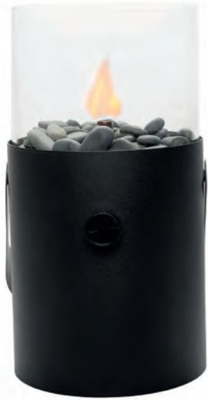
COSISCOOP ORIGINAL negro Ref: COSI0002 EAN: 8712757456505