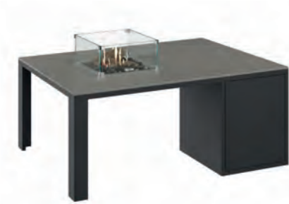
ALESSO 120 COLLECTA negro / gris plomo

Estructura: Ref: ALEN0120 | EAN: 8414706006921 Sobre: Ref: ENCA0120 | EAN: 8414706006990