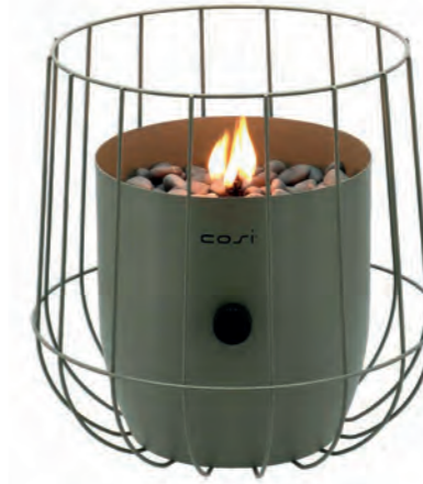
COSISCOOP BASKET verde oliva Ref: COSI0007 EAN: 8712757458875