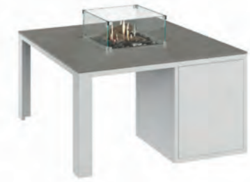
ALESSO 90 blanco / gris plomo

Estructura: Ref: ALEB0090 | EAN: 8414706007034 Sobre: Ref: ENCA0090 | EAN: 8414706007058