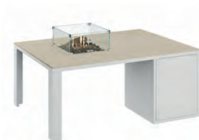
ALESSO 120 COLLECTA blanco / arena

ESTRUCTURA: Aluminio blanco o negro. SOBRE: Madera de teca natural o piedra sinterizada Neolith® en color arena, gris plomo y piedra. MEDIDAS: 120 x 80 x 47 cm QUEMADOR: Cuadrado 30 x 30 x 11 cm. ALIMENTACIÓN: Botella propano BUTSIR PRO 5 kg CONSUMO: 509 g/h máx POTENCIA: 7.000 W INCLUYE: Cristal protector, troncos cerámicos, piedra volcánica y funda de protección. Botella no incluida.