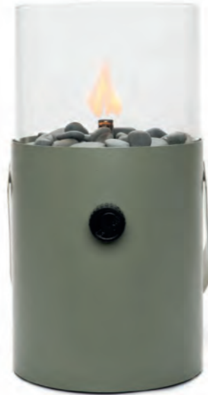
COSISCOOP ORIGINAL verde oliva Ref: COSI0004 EAN: 8712757455225