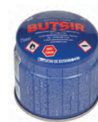
CARTUCHO B-190 MEDIDAS: Ø9 x 9 cm REF. CARB0005

Para apagar el farolillo, girar el botón completamente hacia la derecha. Eso extinguirá la llama. Guardar en un lugar bien ventilado.