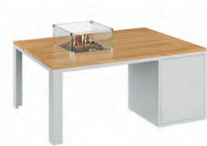
ALESSO 120 COLLECTA blanco / teca

Estructura: Ref: ALEB0120 | EAN: 8414706006938 Sobre: Ref: ENCP0120 | EAN: 8414706007010