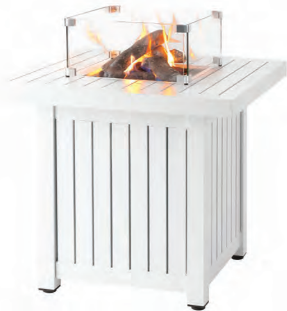
Ref: FIRE0017 EAN: 8414706006822

ESTRUCTURA: Aluminio negro o blanco mate de alta calidad. Tapa de aluminio del mismo color, para cubrir el quemador. MEDIDAS: 71 x 71 x 62 cm ALIMENTACIÓN: Botella propano BUTSIR PRO 5 kg CONSUMO: 475 g/h máx. POTENCIA: 6.800 W INCLUYE: Cristal protector, troncos cerámicos, piedra volcánica, tapa para cubrir el quemador y funda de protección. Botella no incluida.